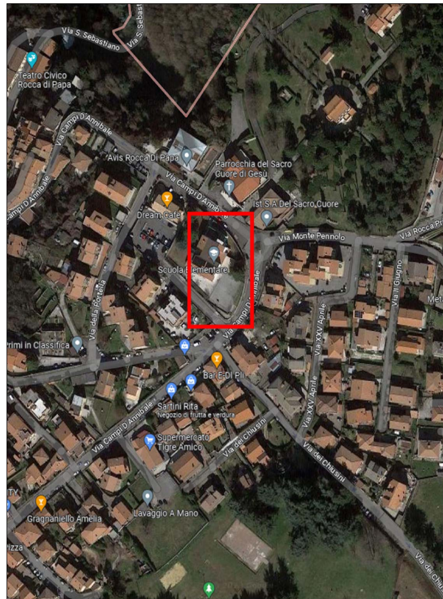
VISTA AEREA Approvato con Deliberazione Consiglio Regionale n5 del 21.04.2021