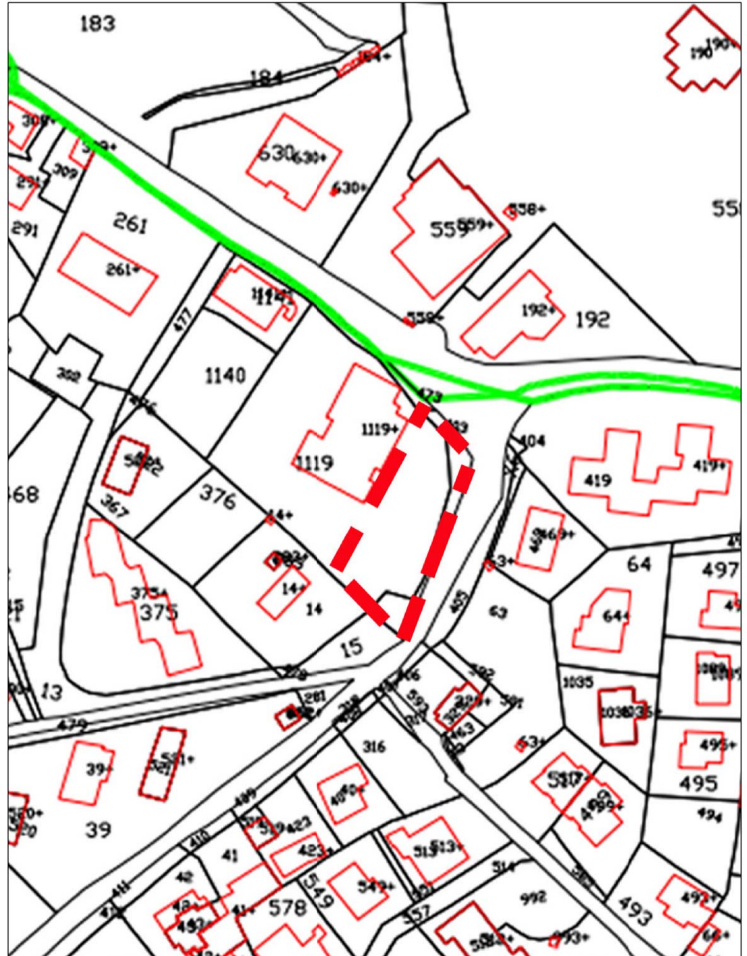
AREA D' INTERVENTO - - - - -