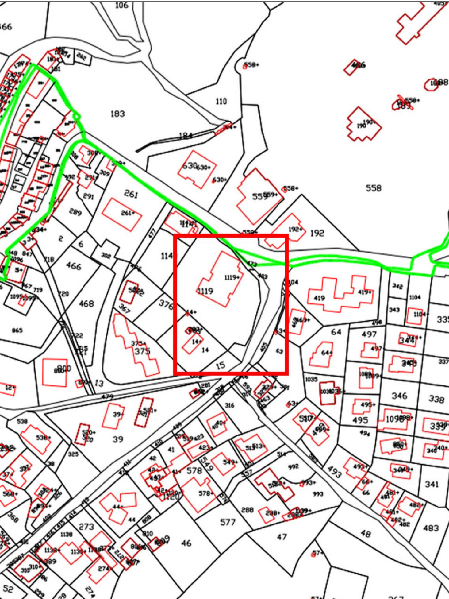
CATASTALE LUGLIO 2014 - PARTICELLA 1119 - FOGLIO 11 - SCUOLA ELEMENTARE Sc 1:1000