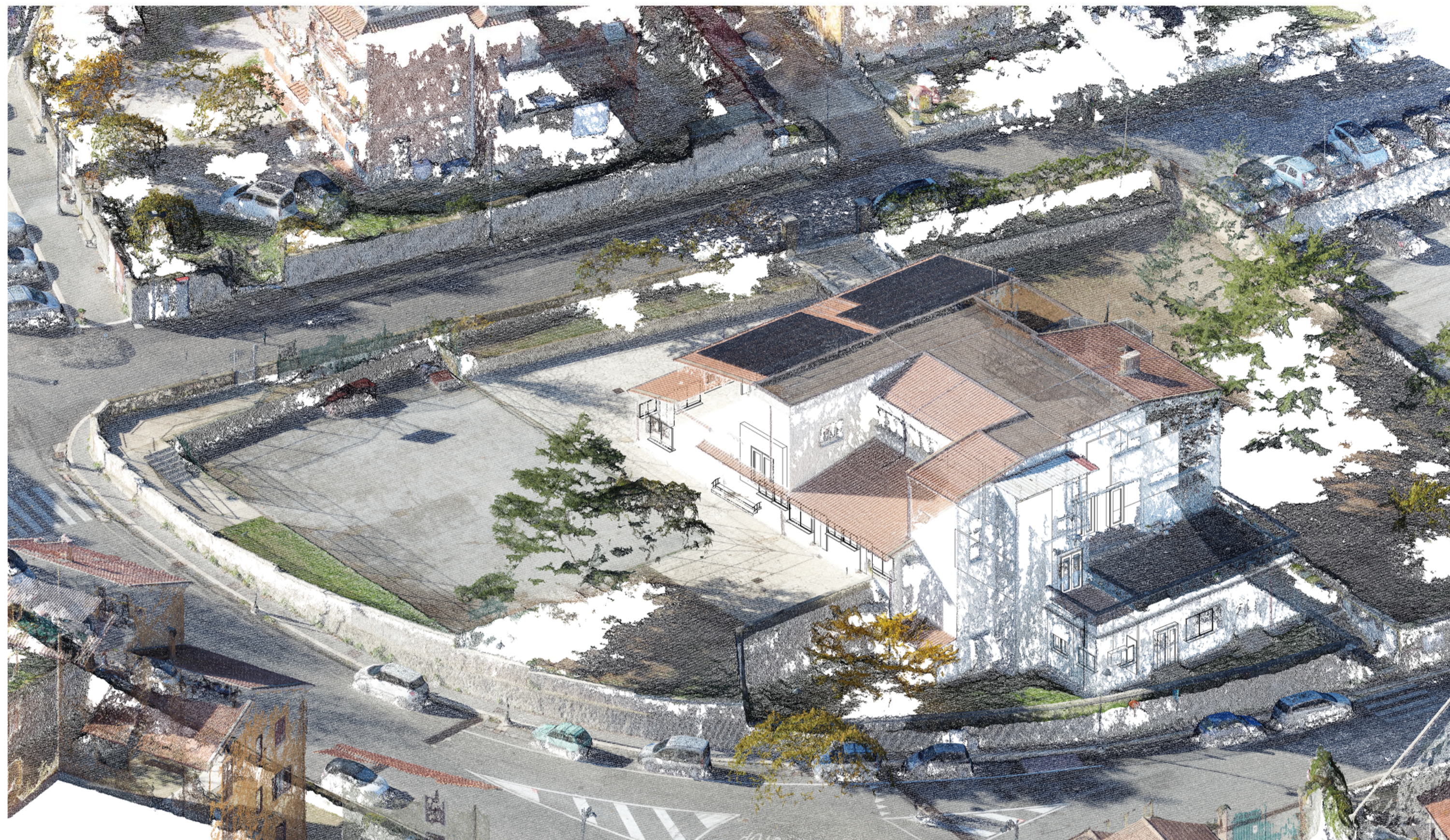
NUVOLA PUNTI - STATO ATTUALE