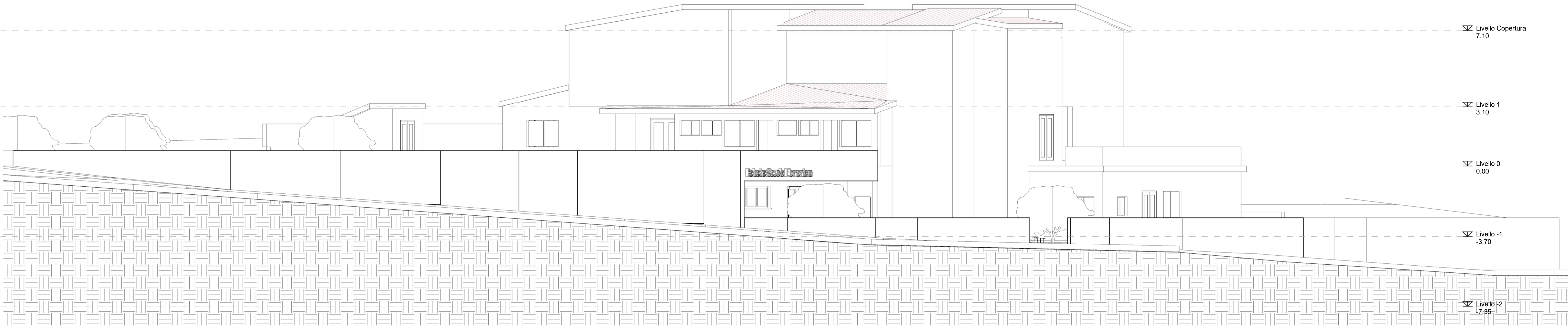
PROSPETTO EST - STATO DI PROGETTO