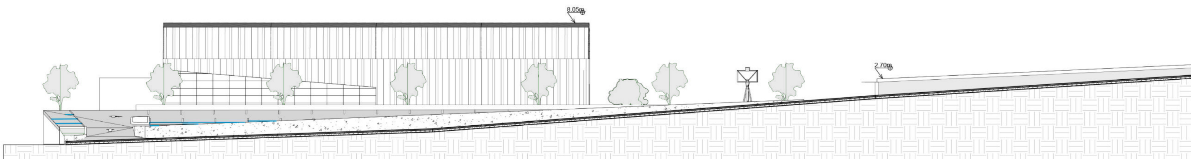
② Profilo Dalla Strada - Stato Progetto 1 : 200