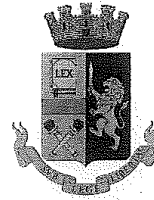
Commissariato di P.S. distaccato Frascati