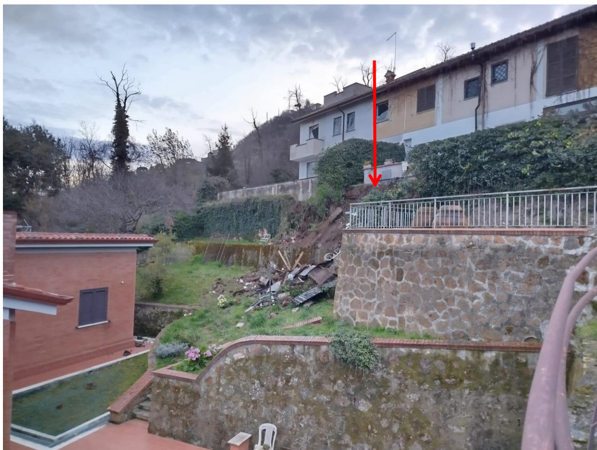
Fotografie scattate a marzo 2025 dopo il crollo e prima dell'apposizione del telo di sicurezza