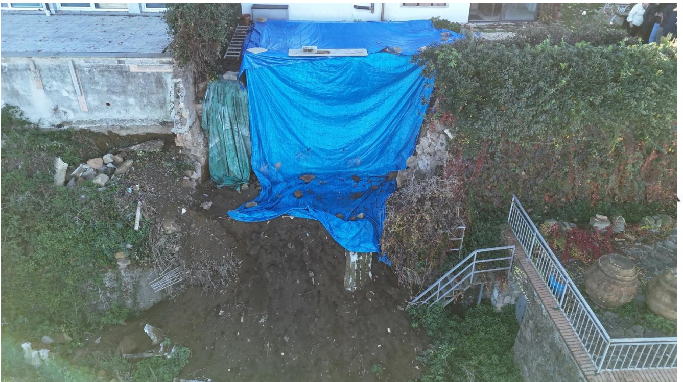
Rocca di Papa, 11/12/2025